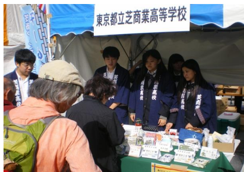
＜ 模擬株式会社「芝翔」の販売実習風景＞